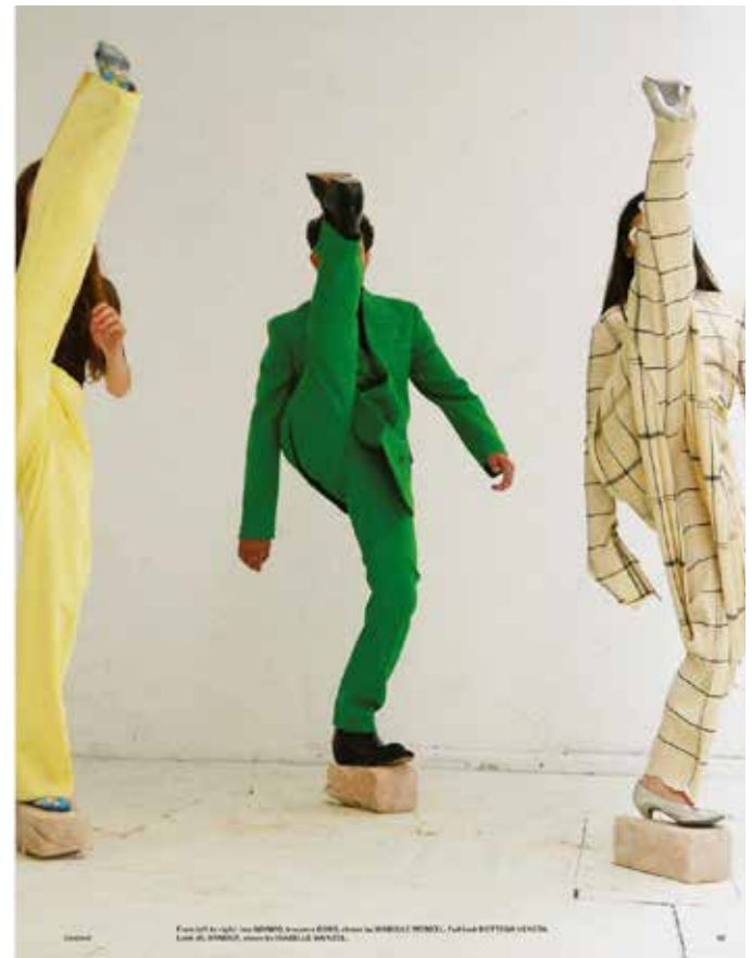
© Isabelle Wenzel: Movement directing, 2022

davon zu erstellen. Die Teilnehmenden können hier experimentieren und herausfinden, auf welche interessanten Arten Mode mit Bildern eingefangen werden kann. In einem Rundgang durch die Ausstellung „SIE MUSS NICHT IMMER SCHILLERND SEIN – Modefotografie“ im Fotografie-Forum Monschau werden wir uns ansehen, wie verschiedene Fotografierende von den 1920er Jahren bis heute Mode auf Fotos festgehalten haben, und unterschiedlichen Darstellungen von Mode diskutieren. Spiegelreflexkameras und Lichtausrüstung sind vorhanden, Kleidung und Accessoires am besten mitbringen.