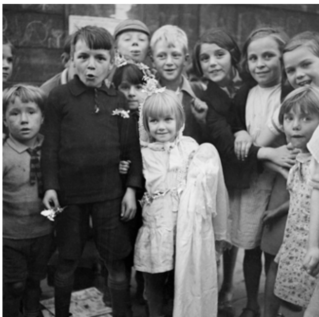
„Hochzeit“ mit Kleidern aus der Mülltonne, Edith Tudor-Hart, London, ca. 1932.

Wir betrachten auch die Werke von Anton Stankowski und Fide Struck, um Gemeinsamkeiten und Unterschiede in den Ansätzen und Stilen der Fotografen zu erkennen und zu verstehen. Anschließend experimentieren wir in der Altstadt von Monschau mit Spiegelreflexkameras. Wir suchen nach geeigneten Motiven und verborgenen Perspektiven, um unseren eigenen Blick für Motive zu verfeinern.