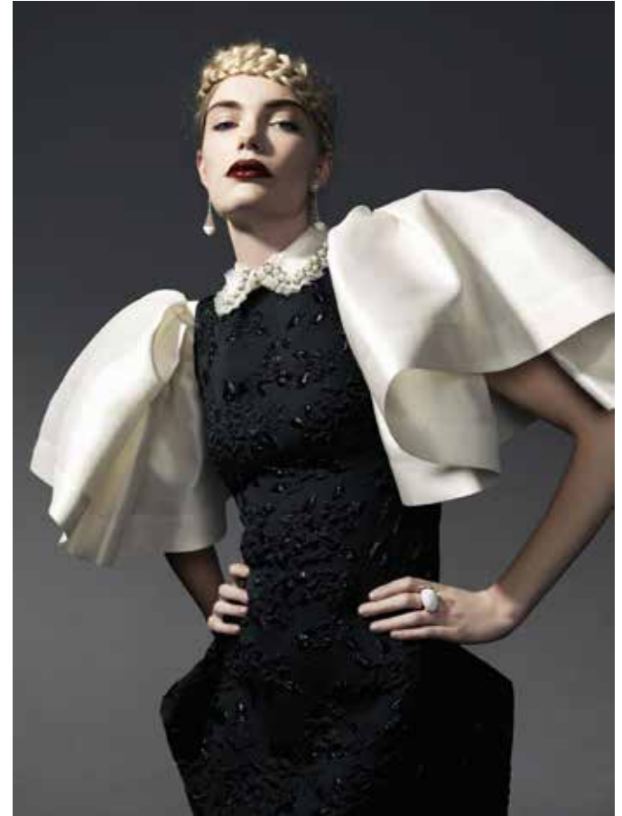
© Hugo Thomassen, Edwin Oudshoorn Couure House,

Zu jedem Thema gibt es praktische Übungen und Aufgaben. Am Ende des Workshops werden die Ergebnisse der Teilnehmenden gemeinsam besprochen und in einer Ausstellung präsentiert.