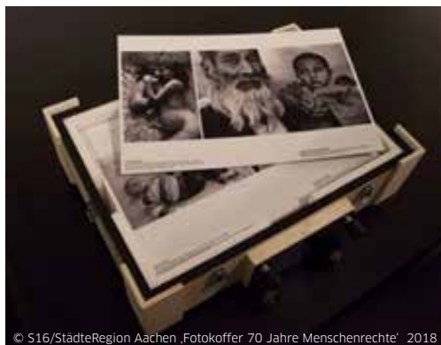
© S16/StädteRegion Aachen „Fotokoffer 70 Jahre Menschenrechte“ 2018

die Menschenrechte aufzuklären. Dazu hält der Foto-Koffer 35 Abzüge mit je einem Bilderpaar zur Veranschaulichung der 30 Artikel der Menschenrechte bereit, die dann für den Unterricht unterschiedlich genutzt werden können.