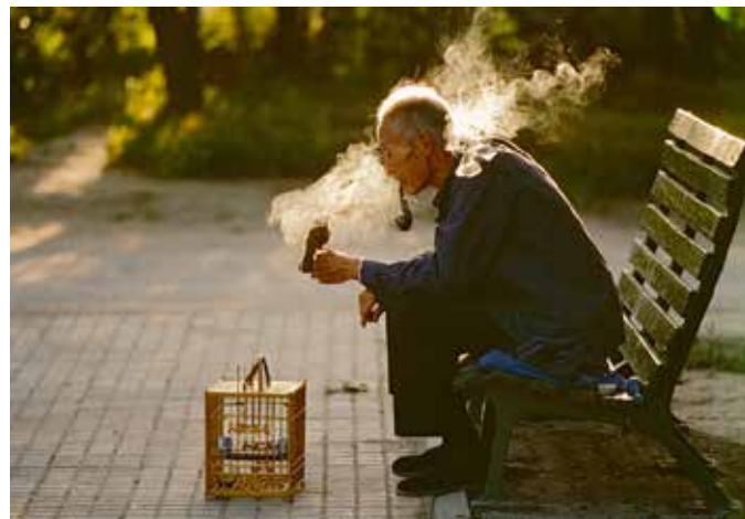
CHINA, Beijing, 1984. Old man with his pet bird in Ritan Park.

Im zweiten Teil des Workshops werden die Teilnehmer_innen mit Spiegelreflexkameras eigene Fotos von Menschen auf Parkbänken zu kreieren. Der Kreativität sind hierbei keine Grenzen gesetzt! Ob als Gruppe oder allein; ob stehend, sitzend oder liegend; ob ernst oder albern – Bänke bieten den Raum, sich auszuprobieren.