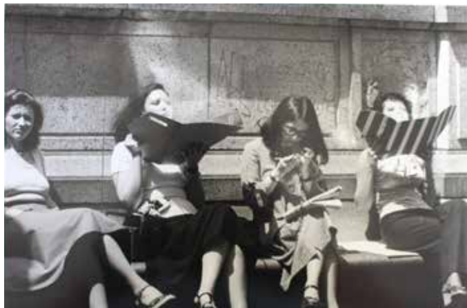
© Barbara Klemm „New York, USA, 1976“

Alle Angebote sind, wie auch der Eintritt, kostenfrei.